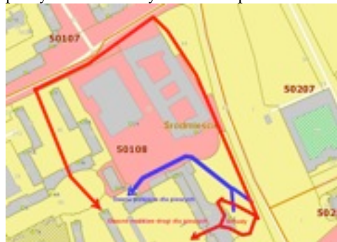
Drogi dojścia do posesji Nowolipie 2B,3,5,7,9/11 i Nowolipki 9,9A,9B,11 i 11A; niebieska zamknięta przez KSP i czerwona używana obecnie

W poprzednim numerze opisywaliśmy utrudnienia jakie mają mieszkańcy i niepełnosprawni użytkownicy lokali z rejonu Nowolipie 2B, 3, 5, 7, 7A, 9/11, Nowolipie 9, 9A, 9B, 11, 11A w związku z zamknięciem przez KS Policji w czasie stanu wojennego ścieżki dla pieszych wzdłuż budynku Nowolipie 3.