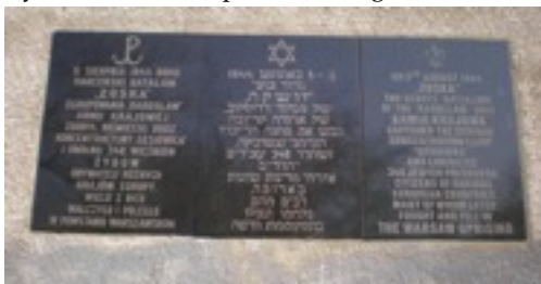
Tablica upamiętniająca zdobycie więzienia na Gęsiówce w sierpniu 1944r

Warto pamiętać, że po stłumieniu przez hitlerowców w 1943 r. powstania w getcie, teren dawnego getta był miejscem walk w powstaniu warszawskim. To tutaj 5 sierpnia 1944 r. Harcerski Batalion Szturmowy „Zośka” (harcerze z Szarych Szeregów) zdobył więzienie na Gęsiówce (w tym czasie Konzentrationslager Warschau ) uwalniając 384 więźniów w tym też pozostałych przy życiu uczestników powstania w getcie.