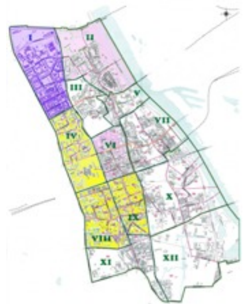
Plan Śródmieścia z podziałem na osiedla; na żółto oznaczone osiedla, w których w październiku 2012 r. wybrano rady osiedli

W wyniku wyborów powstały więc rady w osiedlach IV, VIII i IX.