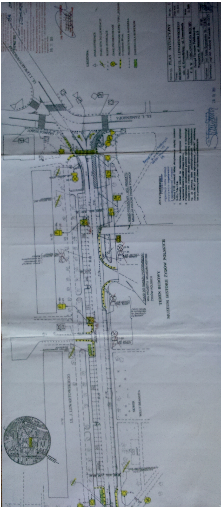
Projekt miejsc parkingowych na ulicy Lewartowskiego